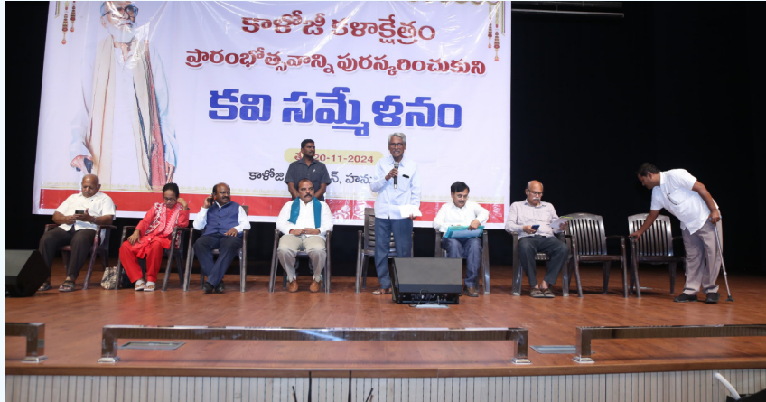
కాళోజ్ కళాక్షేత్రంలో ఫస్ట్ ప్రాగ్రాం అలరించిన కవి సమ్మేళనం

సంపుటి: 2 | సంచిక: 191 | బుధవారం | 20-11-2024 | పేజీలు: 8 | వెల: రూ.3