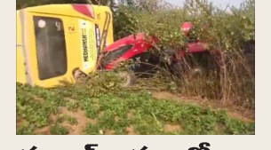
సూల్ బస్సు బోల్డూ విమరు చిన్నారులకు గాలూలు 2